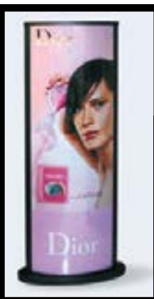
Detalles de peana y tapa.